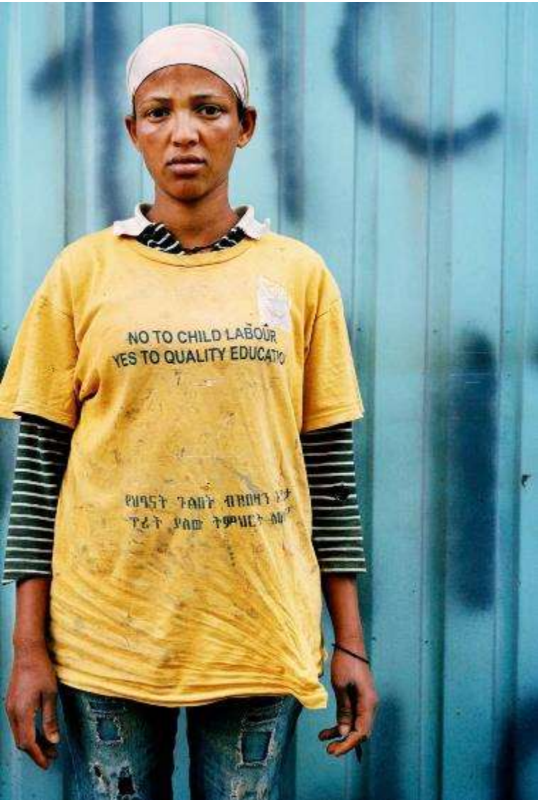
克利斯蒂安·塔索 (Christian Tasso) 攝影。它被作為歐洲聯盟專案「彌合差距II – 殘障人士平等權利的包容性政策和服務」的一部分，並由國際和伊比利亞-美洲行政和公共政策基金會提供。