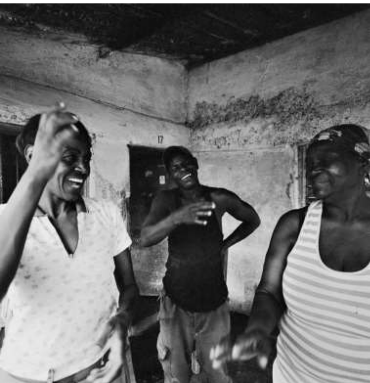
攝影：克利斯蒂安·塔索 ( ChristianTasso ) · 取自「百分之十五」項目。