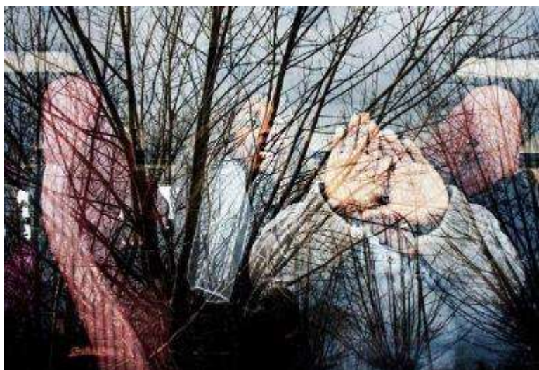
撒哈拉維項目的克利斯蒂安·塔索（Christian Tasso）攝影。