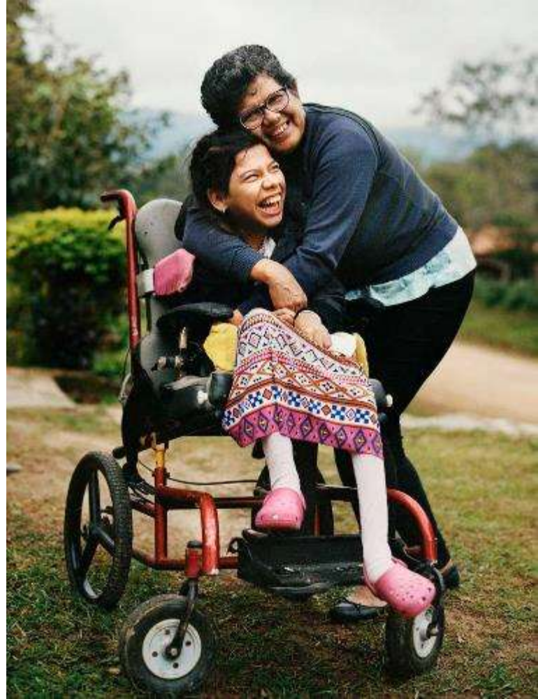
克利斯蒂安·塔索 (Christian Tasso) 攝影。它被作為歐洲聯盟專案「彌合差距 II – 殘障人士平等權利的包容性政策和服務」的一部分，並由國際和伊比利亞-美洲行政和公共政策基金會提供。

(b) 在考慮當地程序和習俗以及符合《身心障礙者權利公約》內容的前提下，設立獨立的中間人機構或協調機構的系統；